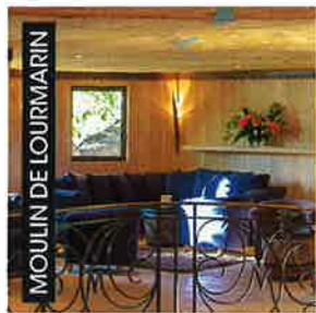
MOULIN DE LOURMARIN

LE PITCH : troisième épisode des péripéties sentimentales et amicales des quatre copains, Éric Elmosnino, Jean-Pierre Darroussin, Marc Lavoine et Bernard Campan, réunis par Marc Esposito. On les retrouve pieds dans l’eau au bord de la piscine du Luberon.